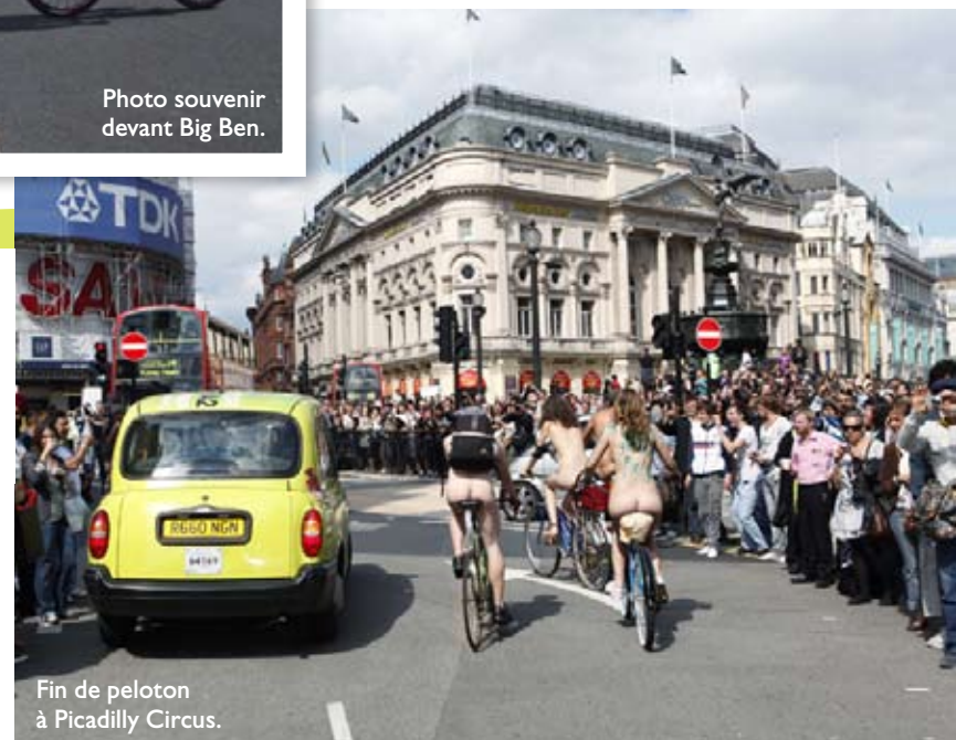
Fin de peloton à Picadilly Circus.

Le 19 juin: à 14 heures à Bruxelles ( www.cyclonudista.be ), à 10h30 à Sheffield et à 16 heures à York ( www.worldnakedbikeride.org ). Infos: www.vivrenu.com Bons plans londoniens: www.visitlondon.com